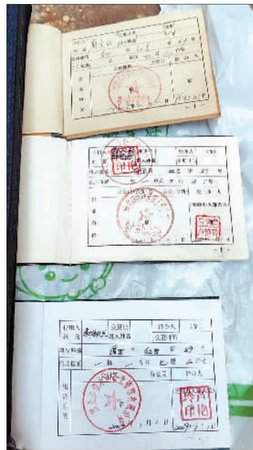
盖不同公章的公房产权证。