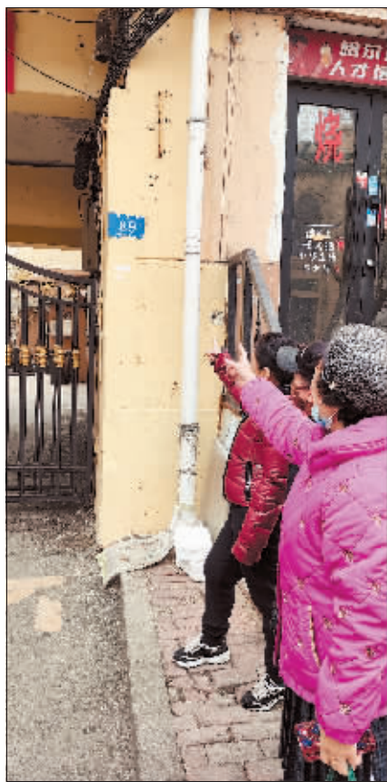
红专街89号居民向记者介绍情况。

本报讯(孙世琦 记者 黄晏君文/摄)近日,记者接到道里区红专街89号部分居民反映,他们上世纪80年代初入户的公产权房,因原产权单位哈尔滨市汽车工业公司已经解体,后经多次整合变更,现已找不到相关产权单位,14户居民至今办不了产权证,也无法过户。