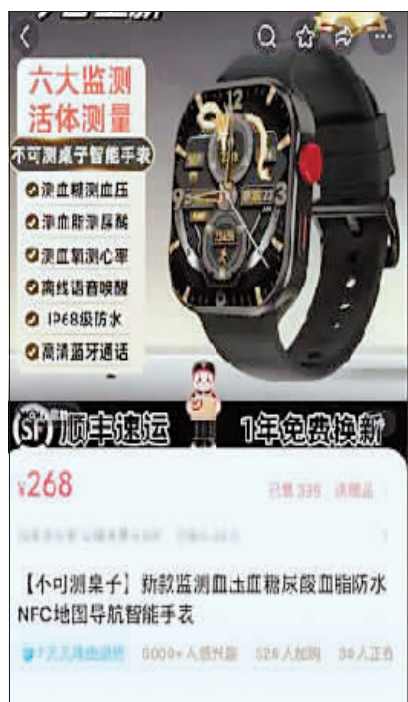
直播间里一款智能手表的功能宣传。