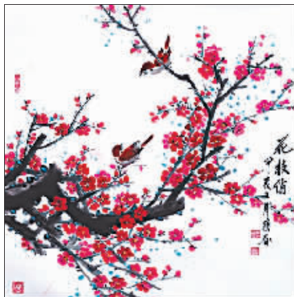
国画《花枝俏》作者 罗颖春