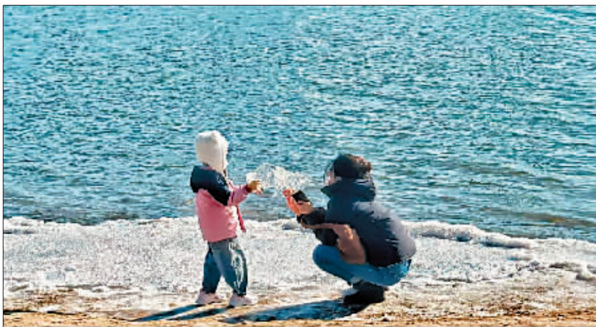
摄影《童梦冰缘》作者 陶滨

狗狗是杂食性动物,偶尔需要摄入一些粗纤维促进肠道蠕动,宠主如果想给狗狗补充均衡的营养,建议喂胡萝卜、西兰花、卷心菜等狗狗喜欢吃的蔬菜,维生素也很丰富。 □葛斌