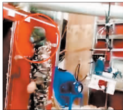
一名工人在生产假羽绒填充物。

员对记者说，他们既生产合格羽绒服，也生产不合格羽绒服，他们会把合格羽绒服的检测报告用在不合格的产品上。这类商家对自己的违规行为心知肚明，但为了牟取利益，他们就建议选择“分仓”发货来躲避监管。监管严的地方就发好货，监管不严的地方就发“充丝”的。