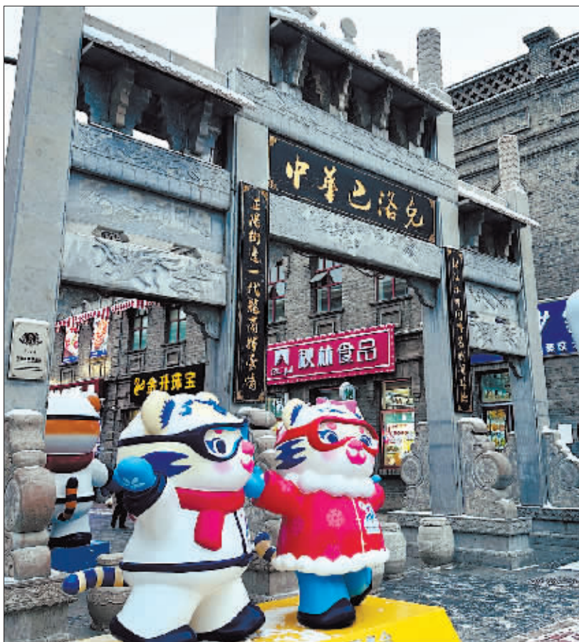
中华巴洛克历史文化街区。

利用滨洲铁路桥至滨北公铁桥中间145万平方米区域,建设冰雪启航、江上飞舟、冰雪竞速、冰雪远航四大主题分区,每日可接待游客9万人。其中在闯关东广场对应的江面上,建设一处以船舵图案为圆心、8个船锚环绕的冰雪潮玩主题乐园,创新采用气垫船为交通工具,将各主题分区有效串联至雪博会和冰雪大世界,规划了一条贯穿南北的冰雪旅游交通专线。打造多处网红景观打卡地,建造大型冰雪辽宁舰,设置冰球、冰壶、雪地足球等免费游乐区域,举办超级跑车邀请赛、冰雪漂移表演赛、冰雪ATV趣味赛、雪地摩托表演赛、冰雪UTV统规赛、新能源汽车耐力赛等6个类别专业比赛。组织冰雪大闯关和全民打雪仗的“雪对战”等系列活动。重点打造竞技与公益完美融合,提供从专业赛事到趣味活动的全面冰雪体验,涵盖全方位的冰雪文化娱乐到高品质的服务理念,吸引各年龄段的参与者,共同感受冰雪运