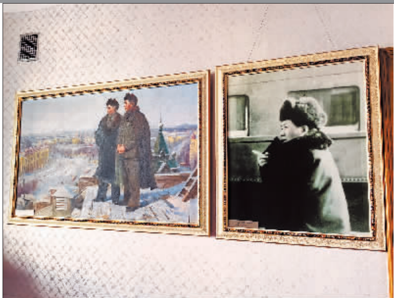
在周恩来总理陪同下，毛泽东主席出访苏联归国途中亲临黑龙江省视察。