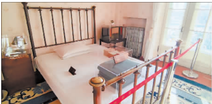
毛主席使用过的铜床。

新晚报 拍卖/公告 项目地址：哈尔滨市松北区太阳岛西侧哈尔滨冰雪大世界园区 冰雪大世界联系电话：13144527799 拍卖时间：2024年12月10日9时开始 拍卖公司及拍卖会地址：哈尔滨公共资源拍卖有限公司，哈尔滨市抚顺街1号 拍卖公司联系电话：0451-58700011