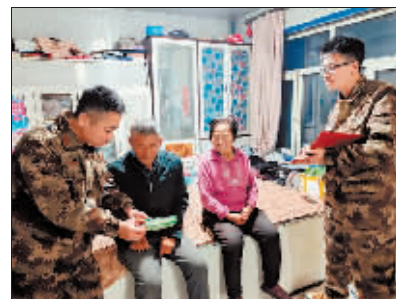
工作队员登记购买药品清单。

队员们挨家挨户记录村民的购药需求,建立了一份详细的《村民需要购买药品清单》,上面不仅记录了药品的名称、价格、图片,还标注了每位村民的姓名和联系方式,最后再与村民及家属逐一核对,确保清单上的药品准确无误。工作队先是在镇内药店采购,清单