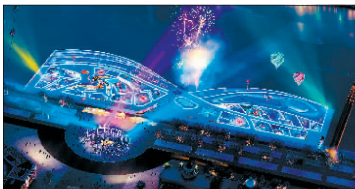
冰雪嘉年华效果图

今冬,第七届哈尔滨松花江冰雪嘉年华围绕“快乐冰雪·同梦亚冬”这一主题,项目东起网红铁路桥、西至通江广场,打造冬游哈尔滨极具娱乐