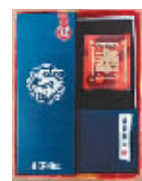
一等奖 膳魔师福瑞龙杯

在“冰城+”客户端统一进行开展展播,根据点赞数量评出一等奖1名、二等奖3名、三等奖5名、优秀奖10名。由哈尔滨市公安局授予反诈优秀个人和单位称号。