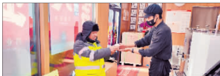
给清雪工人端杯热饮。

已经制作完毕,加入公益联盟的单位和商户可以派员来报业大厦一楼广告大厅领取。同时,欢迎企事业单位和沿街商家继续加入本报“温暖驿站”公益联盟,为传播冰城温暖做一份努力。