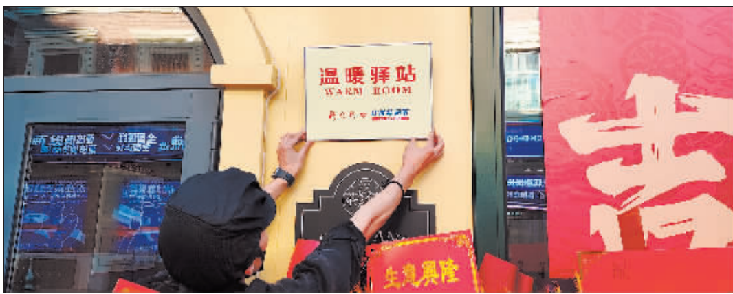
加盟商户挂上“温暖驿站”牌子。

已经制作完毕,加入公益联盟的单位和商户可以派员来报业大厦一楼广告大厅领取。同时,欢迎企事业单位和沿街商家继续加入本报“温暖驿站”公益联盟,为传播冰城温暖做一份努力。