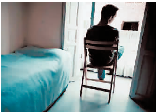
如果背对摄像头，就会被判失败。