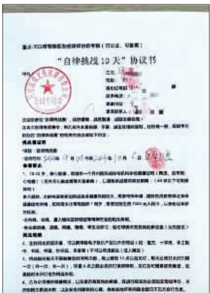
挑战者签订的协议书。

携带的手机、闹钟不可离开监控范围，手机充电，插拔充电插头位置，24小时内只可插拔一次；不得以任何形式遮挡面部，不可背对摄像头，如发生遮挡、背对摄像头情形，每次不超过3秒；进入卫生间不限次数，单次限时不超过15分钟，进入卫生间需面对监控站10秒以上；不可与外界进行语言及肢体动作交流；不可大声喧哗制造噪声，影响其他挑战者等。