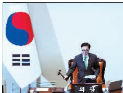
韩国国会议长禹元植宣布弹劾动议案表决通过。

此外，有分析认为，这是尹锡悦本人有意选择被弹劾而不是接受执政党提出的“提前下台”方案。宪法法院对总统弹劾案的审理程序比执政党提出的“提前下台”方案所需时间更长，存在变数更多。尹锡悦宁受弹劾不愿辞职，体现出他有意在宪法法院审理中争取翻盘的意向。