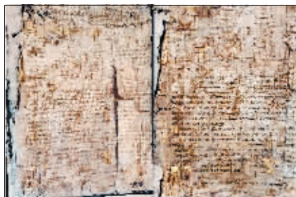
布夹包内发现的纸张。

玉宝取得联系。11日，该馆收到这份史料后进行专业鉴定，初步认定这是关于“大赉县流行病学调查报告”残件，可能与侵华日军进行的细菌战有关。其中“大赉县”原隶属于黑龙江省，今属吉林省大安市，