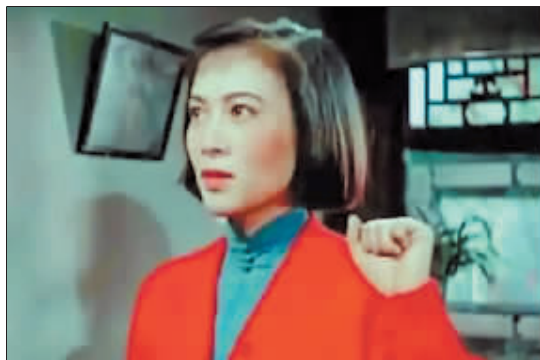
谢芳在《青春之歌》中饰演林道静。

随后,谢芳陆续出演了《舞台姐妹》《早春二月》《山花》《李清照》《清水湾 淡水湾》《文成公主》等50多部影视剧,成为了家喻户晓的电影明星。