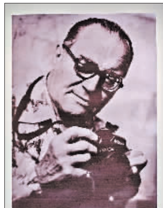
阿布拉姆斯基·弗拉基米尔·帕夫洛维奇,1904年出生于波兰,毕业于莫斯科大学,在哈尔滨从事摄影记者、体育教练工作,擅长冰雪体育运动。他用相机记录了哈尔滨侨民参加冰雪体育运动的照片,成为哈尔滨冰雪体育运动的先驱。

“为了迎接1958年1月在哈尔滨市召开的全国20城市职工冰上竞技大赛……必须进行系统的训练、互相学习、交流经验才能继续提高技术水平……因此经领导研究确定抽调你产业某某同志进行短期脱产集训……先带10天粮票和伙食款……”一张1957年12月印发的《哈尔滨市工会联合会通知》,充满了年代感。