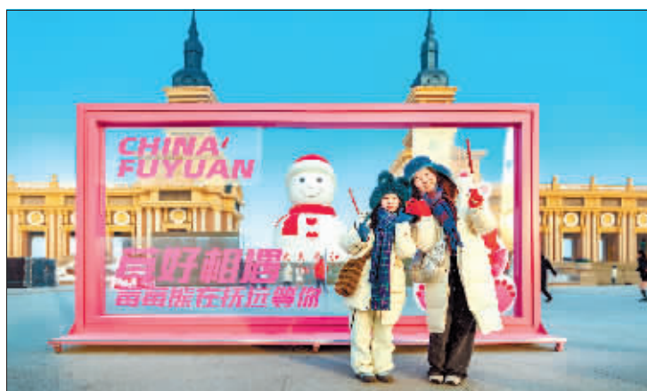
摄影《打卡大雪人》 作者 门奎