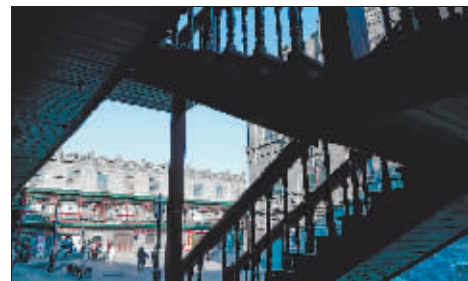
有别于南方的“合院”,巴洛克的中式四合院错落有致,别有一番风味。

展示了面塑、糖画、泥匠、沙画、剪影、草编等手工艺,也创造了独特的美食文化,老式熏鸡、干肠、小肚、金丝卷、扒肉、月饼等风靡百年。同时,还创造了众多闻名遐迩的老字号、老品牌,老鼎丰、哈尔滨大罗新、正阳楼、张飞扒肉、张包铺、红光馄饨馆、老范记、北山酒馆等,百年惊艳着人们的味蕾。