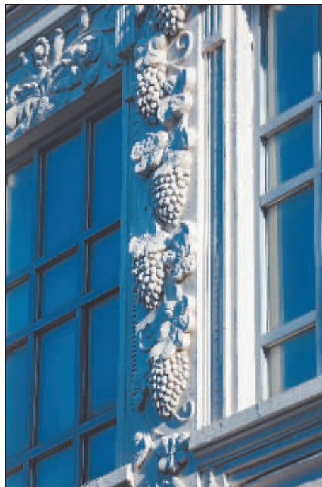
中西合璧巴洛克风格在建筑的每个细节都有充分体现。