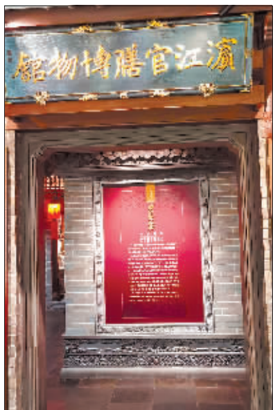
老厨家饮食博物馆。