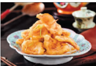
哈尔滨名菜锅包肉。