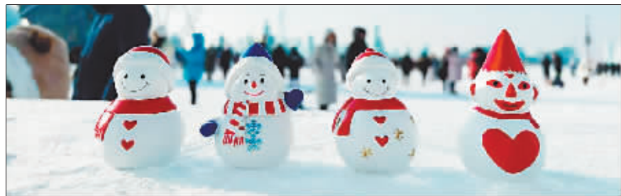
大雪人“盲盒”共有四款。

本地购买地址:哈尔滨市道里区友谊路399号报业大厦 1层 “黑龙江礼物”各大门店陆续发售