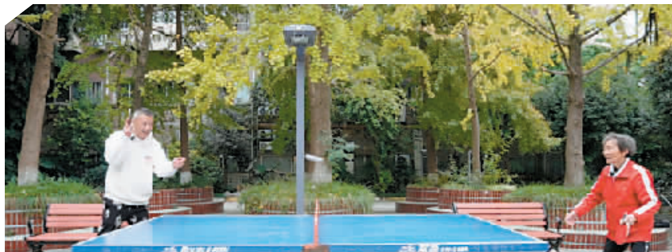
▲母子俩一起打乒乓球。