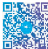
扫码观看全景作品

友可以在线欣赏到哈尔滨冰雪大世界的气势恢宏、太阳岛雪博会的美轮美奂以及冰灯艺术游园会冰灯的精雕细琢。这不仅为哈尔滨的冰雪旅游注入了新的活力,更为全球游客提供了一个全新的视角来欣赏和感受这座城市的美丽与魅力。