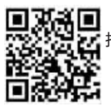
扫码下载安装“冰城+”客户端

大赛主办方表示,希望通过此次大赛,汇聚各方智慧,让哈尔滨的美以全新、多元的形式广泛传播,吸引更多人走进哈尔滨、爱上哈尔滨。大赛战鼓已播响,静待创作者们用镜头书写大美哈尔滨的新画卷。