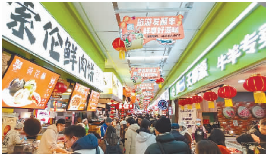
道里菜市场人流涌动。

紧邻道里菜市场的衣彬之家服装城，成为今冬游客又一热门打卡目的地。除了选择在哈尔滨旅游的保暖“战衣战靴”外，游客还可以穿上东北特色服装来一场“打卡之旅”。“所有衣服可以上身随便试，大花袄穿身上挺暖和，不想脱下来，而且价