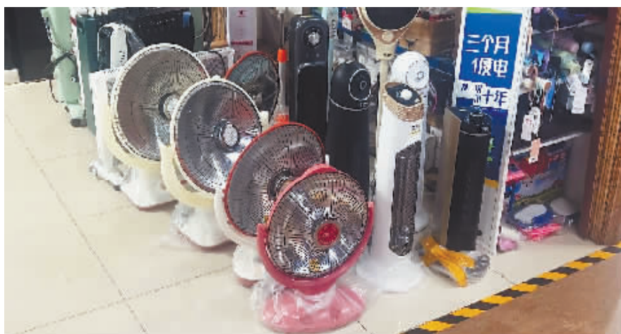
记者在市面上看到的各式取暖器。

而记者网购的一款实木暖脚器,电商平台显示销量超10万件。拆箱后,刺鼻味道明显,产品的木头部分有很多扎手的毛刺,标志贴纸摇摇欲坠,相关信息不全。记者还注意到,上述几款产品的电源软线都没有按相关要求固定,可以轻易拉