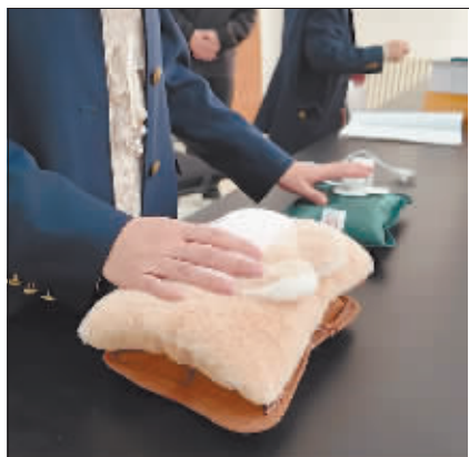
工作人员检测一款毛绒暖手宝。

扯、晃动。经山西省检验检测中心鉴定,这几款产品或缺少3C认证标志,或标志、结构、电源连接和外部软线等不符合《家用和类似用途电器的安全》系列标准规定,为不合格产品。