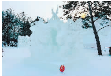
一等奖《鄂伦春之恋》

本报讯(记者 李木双)1月13日,由太阳岛国际雪雕艺术博览会主办的国内级别最高的雪雕赛事——第三十一届全国专业雪雕比赛落下帷幕。大连队的作品《五福临门》、星梦队的作品《鄂伦春之恋》获一等奖。