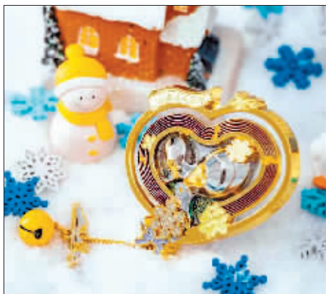
哈尔滨大剧院互动款冰箱贴

产品以锌合金与亚克力结合,烤漆与3D打印工艺精制,方寸间展现百年中央大街的繁华与风情。配备AR互动功能,带你沉浸式漫步街头,感受历史与文化的脉动。DIY设计更添个性,每一枚都可成为专属记忆载体。这不仅是一款冰箱贴,更是承载城市故事的艺术品,让时光与情感于指尖流转。