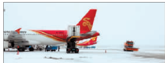
2024年11月26日哈尔滨机场停机坪。

2024年入冬首场大范围强降雨雪天气过程出现在11月25日至29日,比常年偏晚19天。本次过程降水相态复杂,先后出现雨、雨夹雪、雪。25日白天到夜间为雨,26日早晨自西南向东北雨转雨夹雪转雪。本次过程全市平均降水量为21.0毫米,是常年同期的8.5倍,为1961年以来历史同期第一多。