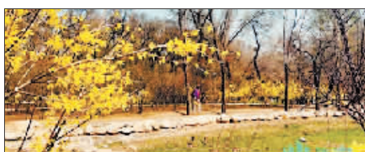
2024年4月18日香坊区劳动公园春意盎然。

4月中旬起,气温明显升高。2024年4月11日,为入春开始日,比常年入春日期提前12天。草木萌发、迎春花绽放,充满希望的春天提前到来。