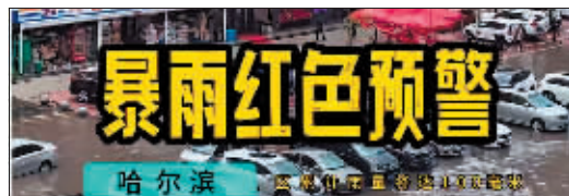
2024年7月31日,市气象台发布暴雨红色预警。

2024年7月31日,受台风“格美”残余云系影响全市出现区域性暴雨,西北部和东南部降大暴雨为科学应对此次强降雨天气,哈尔滨市防汛抗旱指挥部当日9时30分启动防汛四级应急响应、哈尔滨市气象台于当日14时50分发布暴雨红色预警信号